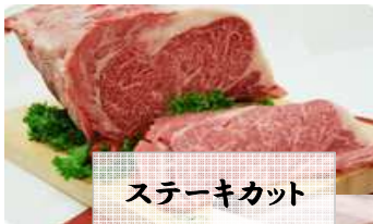
ステーキカット ヒレ・ロース