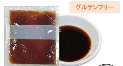
MULTI-USE Teriyaki Sauce