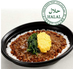
スパイシーチキンライス