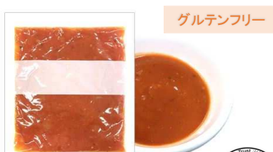
MULTI-USE Tomato Sauce