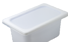
業務用 2L / 4L パック