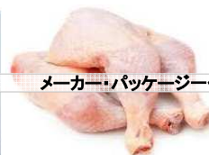
メーカー・パッケージ例