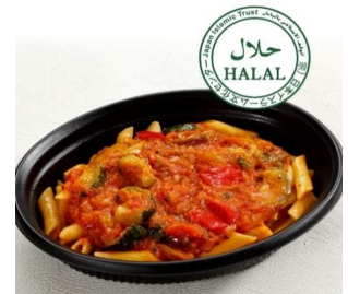
ベジタブルペンネ