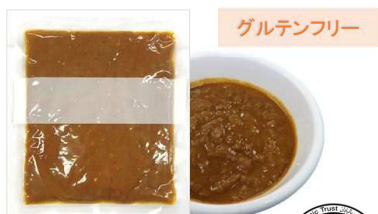
MULTI-USE Curry Sauce