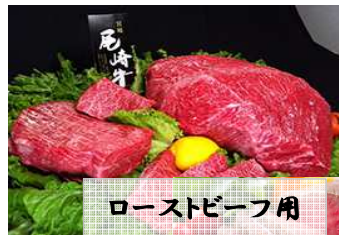
ローストビーフ用