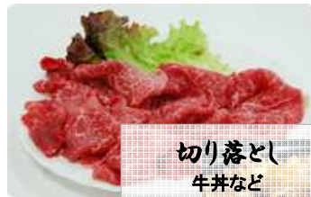
切り落とし 牛丼など