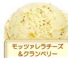
モッツァレラチーズ & クランベリー