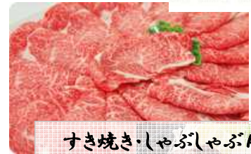
すき焼き・しゃぶしゃぶ用