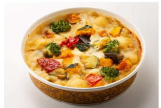
野菜のクリームパスタ