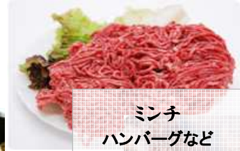
ミンチ ハンバーグなど