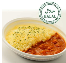
バターチキンカレー