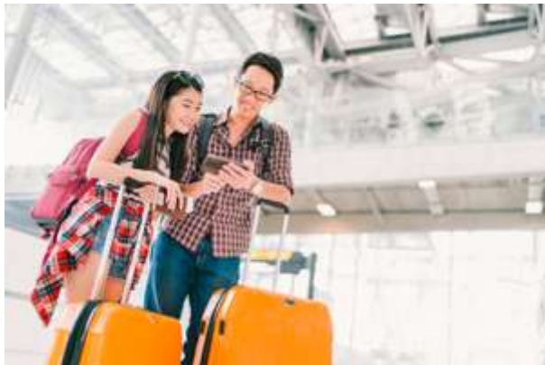
訪日ベジタリアン