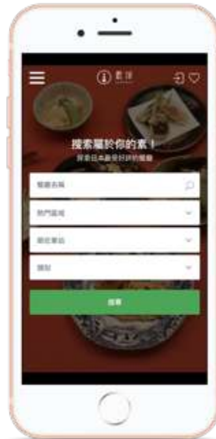
飲食店・ホテル・メーカー